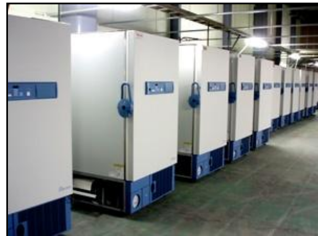
朝日サンプルバンクサービス室