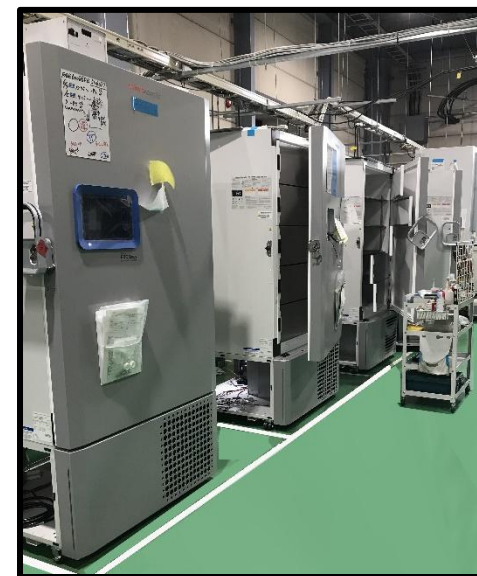
隣接する技術サービスセンター