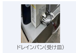
ドレインパン(受け皿)